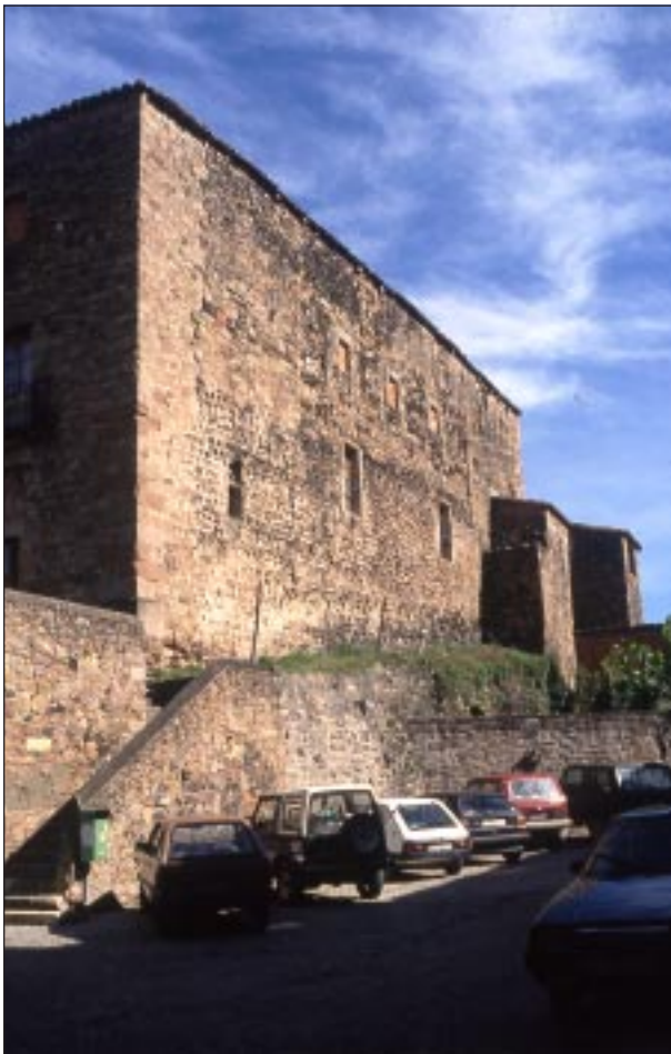
Murs del castell (any 1993).