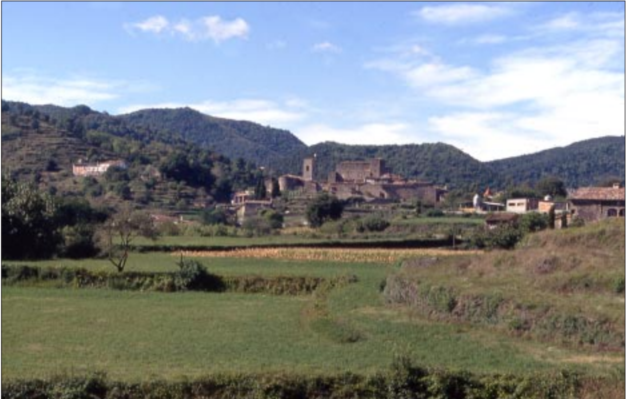
Santa Pau amb el castell i la vila amb la serra de Finestres al fons (any 1993).