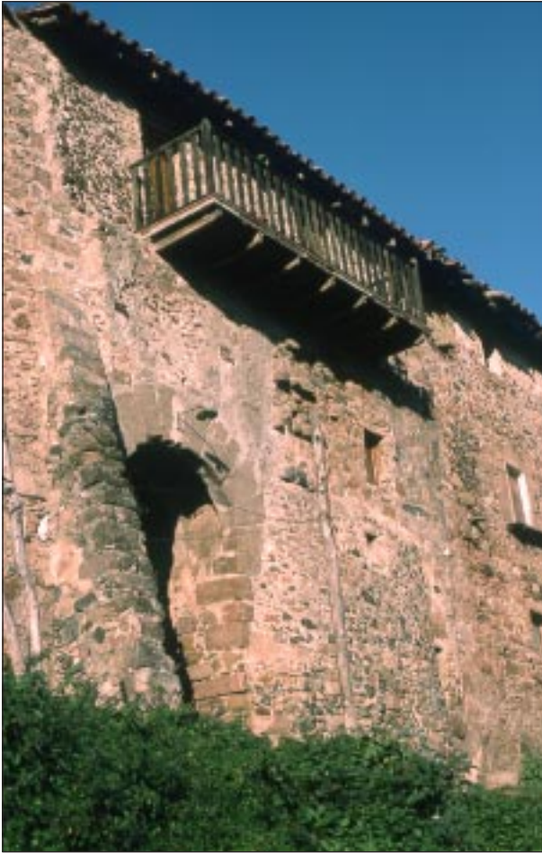
Muralla est, l'any 1993.