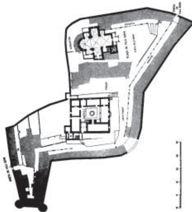
Croquis del castell