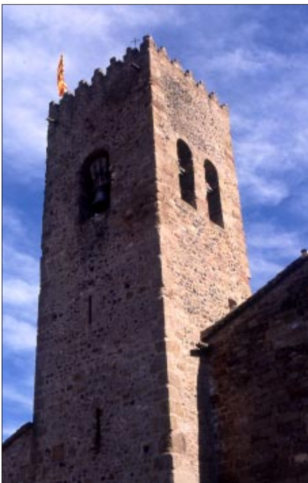
Torre del castell (any 1993).

s'emparentarien amb els Foixà a través del casament de la vídua Gueraula de Ramon Ademar, que havia mort sense successió.