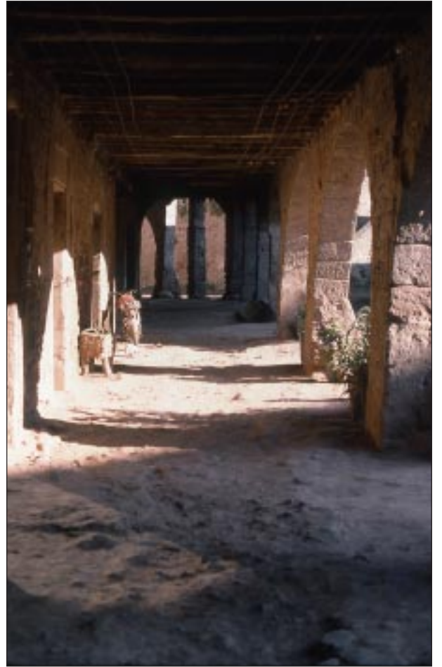
Porxos de la vila de Santa Pau.