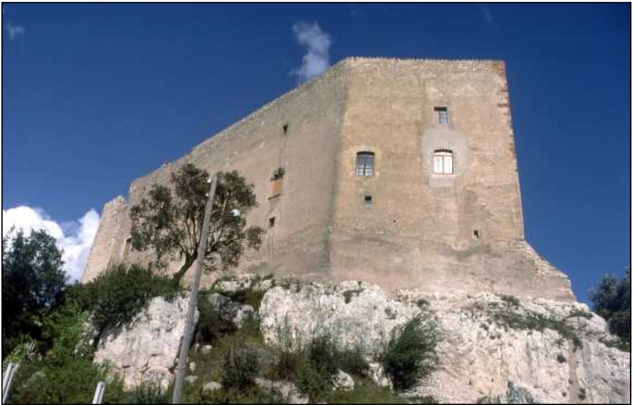
Fotografia presa el maig de 1978 per Jordi Gironès

defendere, guerregare, exceptus lordano, illorum seniore, et Raimundo Mironis». Aquest darrer personatge tendeix, tanmateix, a encarrilar la qüestió, car deu tractar-se d'un fill, si no és ell mateix, que vengué, l'any 1067, unes peces de terra i un mas.