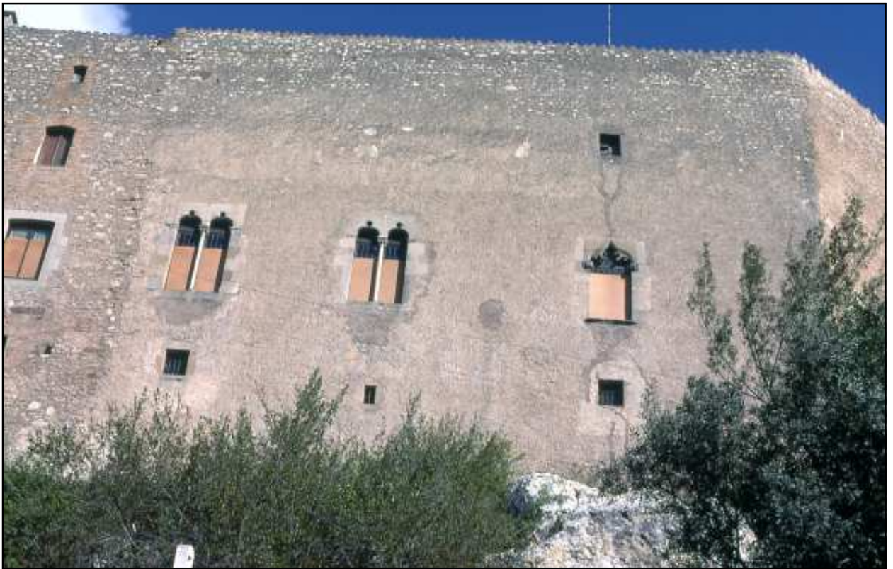
Fotografia presa el maig de 1978 per Jordi Gironès

que foren fetes al castell i en enderrocar una paret, aparegueren armes i peces de vestuari militar corresponents a aquella època. Podem imaginar que aquest castell ofereix una llarga existència senyorial, a desgrat que una llegenda assegurí que mai el castell no ha estat edificat del tot.