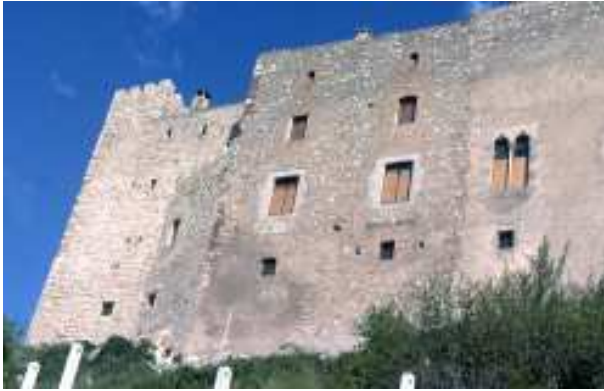
Fotografia presa el maig de 1978 per Jordi Gironès

de 6.000 lliures. Cinc mesos després, el comprador transferí els drets a Ramon del Papiol.