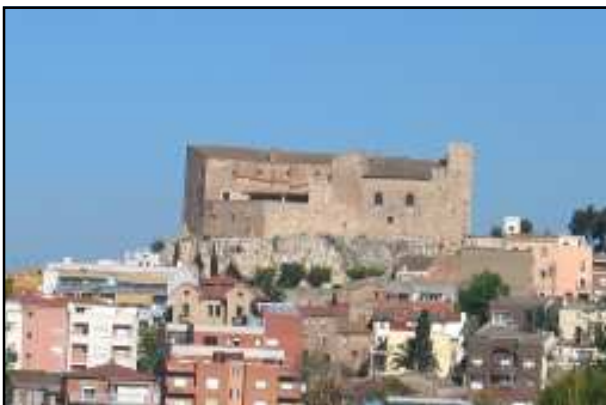
Castell del Papiol.