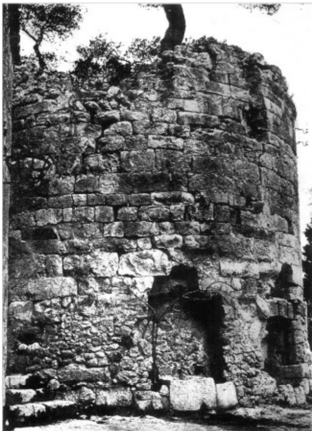
Torre de les Gunyoles abans de la restauració de 1967

Nom del castell: Torre de les Gunyoles Data de construcció: XI Municipi: Avinyonet del Penedès Comarca: Alt Penedès Altitud: 327 m Coordenades: E 1.779299 N 41.352327 (Geogràfica - ETRS89) Com arribar-hi: situat dins el nucli de Les Gunyoles