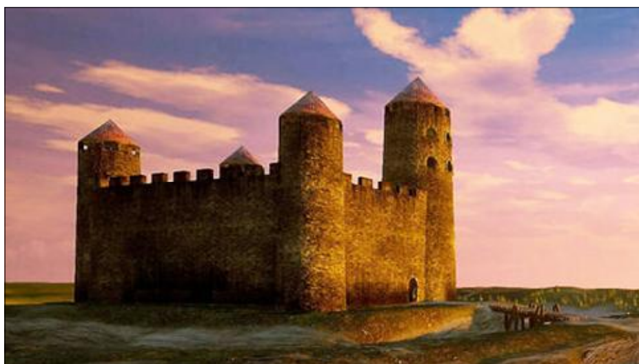
Recreació del castell carolíngi. Museu d'Arqueologia de Catalunya.

La construcció de « Castellum Uellosos » es pot deure a la reocupació, durant la consolidació del domini franc, d'antics establiments i « oppida »