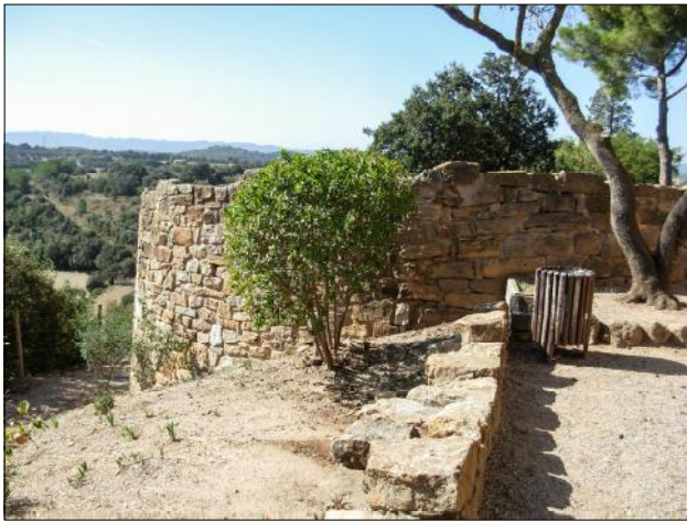
Basament de la torre del sud-oest.

ibèrics, abandonats des de feia molts segles, disposats, sempre, en llocs alterosos, fàcils de defensar, amb excel·lent domini visual. Aquest castell era punt avançat de vigilància i control d'un territori determinat i, sobretot, d'una via antiga i molt important, el camí d'Empúries, que posava en contacte una part considerable de l'actual comarca del Baix Empordà, la Selva i els territoris immediats de Girona, amb Empúries i l'Alt Empordà. Descompost l'imperi carolingi, després d'haver fet arribar la frontera a la Tordera i fins a Hostalric, un « castellum » d'aquestes característiques tenia una funció molt secundària que acabà perdent del tot quan, després de la conquesta de Barcelona, la frontera s'aturà al Llobregat. El castell es va desmantellar i fou abandonat al segle XI. Al segle XV les restes del castell es van convertir en el santuari de Sant Andreu de l'Estany fent referència a l'antic estany d'Ullastret que cobria tota la plana.