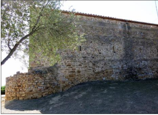
Basament de la torre del nord-est i mur.

De la torre del nord-est resta una part del basament a l'angle del mateix costat de l'edifici del museu. És visible una mica més de la meitat del traçat del seu mur corbat, en una alçària màxima d'uns 2 m. La part alta ha estat força refeta per la restauració. Les dues torres meridionals són molt més vistents, situades només uns 7 m a migdia de l'edifici del museu, la qual cosa dóna una idea de les dimensions reduïdes del castellot. Es troben al caire del vessant abrupte del turó. La més gran, la de l'angle sud-oest, va ser el punt de partida de la fortalesa. És, en realitat, una potentíssima torre ibèrica d'una mica més de 9 m de diàmetre, que devia trobar-se prou ben conservada. Els carolingis la van consolidar i millorar. Les altres tres torres tindrien un diàmetre de poc més de 5,5 m.