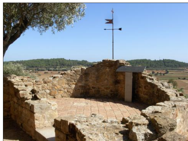
Basament de la torre del sud-est.

Pel que fa al moment precís en què fou creat Velloso hi ha diverses possibilitats, entre el 761 i el 785. El vilar i el « Castellum Uellosos » amb el seu castellar apareixen documentats en diferents