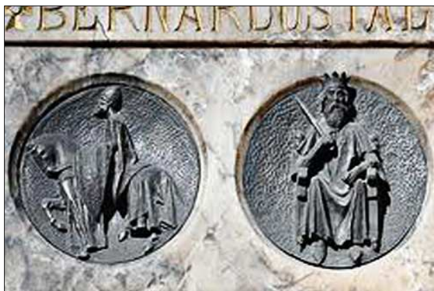
Suposada tomba de Bernat I de Besalú (Monestir de Ripoll).

La figura mítica del Comte Tallaferro, un valent i ferotge lluitador simbolitzant les guerres constants contra els sarraïns dels temps històrics inicials de Catalunya, va ser creada per Jacint Verdaguer el 1886. El mite està basat en el perso-