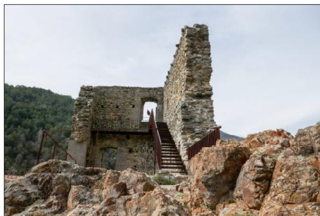
Castell de Ribes a l'abril de 2024. Totes les fotos són de Jordi Gironès.

El castell de Ribes es trobava a la vall del mateix nom i al comtat de Cerdanya, al qual sempre estigué vinculat. El terme del castell comprenia, a més de l'actual terme de Ribes de Freser, els de Queralbs i Pardines; únicament una part del terme de Bruguera pertanyia al terme del castell de Pena. Les primeres notícies del terme corresponen a la vall de Ribes, i es troben en un judici que es realitzà l'any 904, presidit pel comte Miró