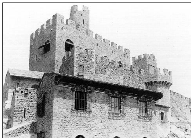
El castell entre els anys 1898 i 1899

Durant la Guerra Civil (1936-1939), el castell fou saquejat i buidat de mobiliari. Després de