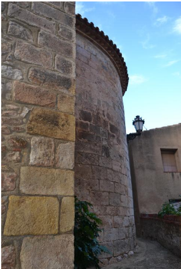
Absis romànic reaprofitat en bastir-se una nova església al final de l'època gòtica

És un edifici molt modificat en la seva configuració original i només conserva de la seva estructura romànica l'absis semicircular de grans dimensions . Aquest absis és construït amb pedra ben