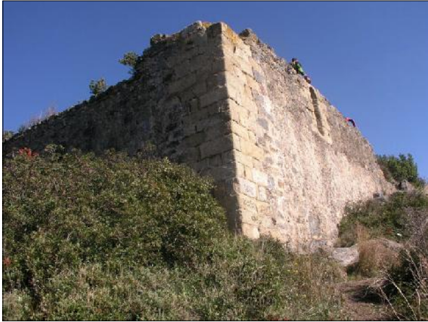
L'angle sud-oest és el més notable.

Durant el segle XVII, la batalla de Montpalau comprenia els termes de Pineda de Mar, Sant Pere de Riu, Hortsavinyà, Sant Pol de Mar, Canet de Mar, Calella, Sant Cebrià de Vallalta i Sant Iscle de Vallalta. Dels Montcada va passar per via matrimonial als ducs de Medinaceli (segle XVIII).