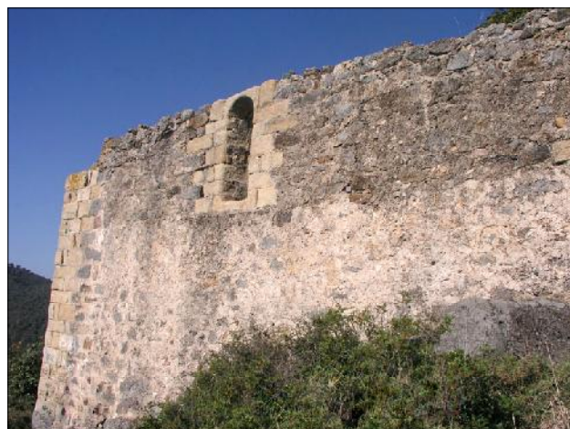
Mur del castell.

Com arribar-hi: situat al cim d'un turó on s'hi accedeix primer per la carretera que va de Pineda de Mar a Hortsavinyà, deixant aquesta carretera per agafar el trencall que du a la C-32. Se segueix sense entrar en aquesta autovia i es passa per sota d'un túnel fins arribar a la masia de can Martorell. A partir d'aquí cal pujar a peu en uns 30 min o en 4x4 fins a prop del cim.