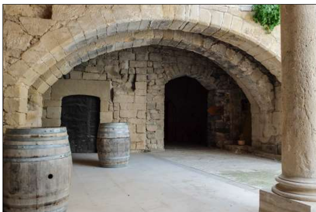
Pati interior.

El conjunt ha estat objecte d'una profunda restauració que ha permès recuperar els espais i els elements originals.