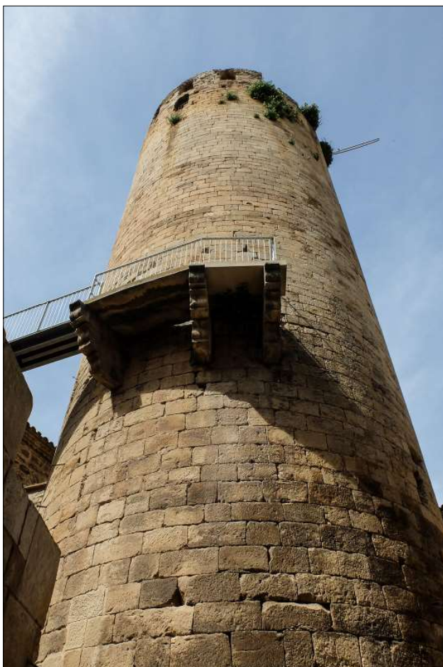
Torre de l'homenatge.