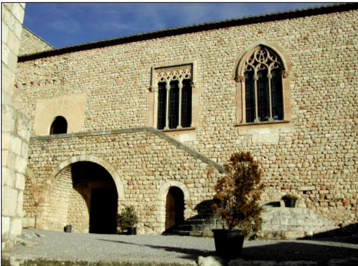
Castell de Sant Martí de Sarroca. Foto de Jordi Gironès