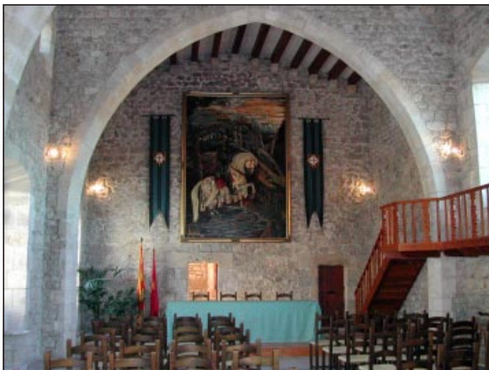
Interior del castell l'any 2002.

Jordi Gironès i Vilardebò novembre de 2006