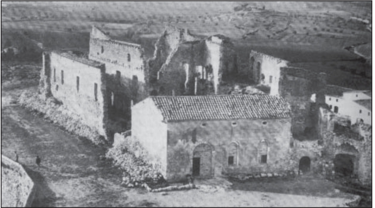
Estat en què es trobava el castell l'any 1960

Enfrontats de nou, el 9 de març de 1016 els jutges atorgaren les propietats al comte Ramon Borrell que tot seguit les donà finalment a Sant Cugat. Aquest xoc d'interessos sobre les possessions territorials va tenir lloc pel fet que les donacions territorials carolíngies va fer fetes a Sant Cugat mentre que les terres obtingudes per apriació van ser posseïdes pels nobles i senyors dels castells, cas d'Adalaidis. Aquesta situació es donà en més d'un cas en el nostre país ocasionant la intervenció de l'autoritat comtal qui finalment disposava dels territoris en litigi. Aleshores cal tenir present que aquest castell, situat a prop de la plana, estava molt exposat a ràtzies musulmanes.