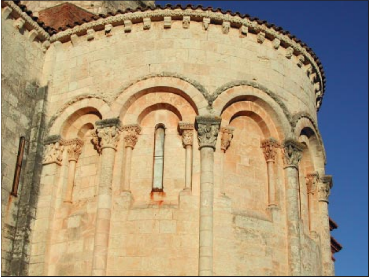
Absis de l'església romànica de Sant Martí del Castell.

Entre els anys 1076 i 1082, Arnau Mir (amb el sobrenom «de Sant Martí») jurà fidelitat al comte Ramon Berenguer II pels castells d'Olèrdola i Eramprunyà, havent heretat també el castell de Sant Martí de la seva mare Guilla. A principis del segle XII el succeí el seu fill Jordà de Sant Martí.