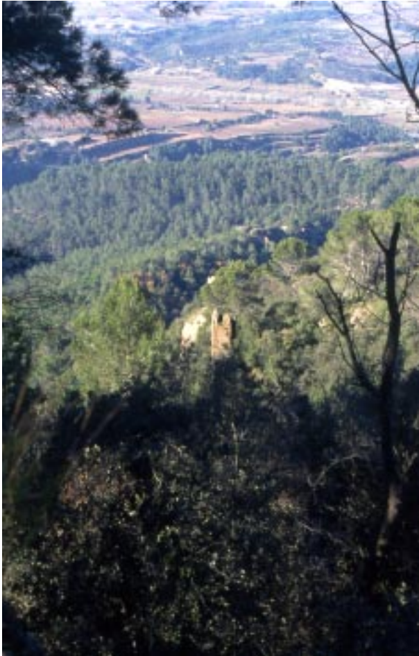
Torre del castell amb la plana del Penedès al fons.

influència a la cort comtal i la ciutat de Barcelona. La baronia de Castellvell comprenia els municipis actuals d'Abrera, Castellbisbal, Castellví de Rosanes, Martorell, Sant Andreu de la Barca, Sant Esteve de Sesrovires i Olesa (1076).