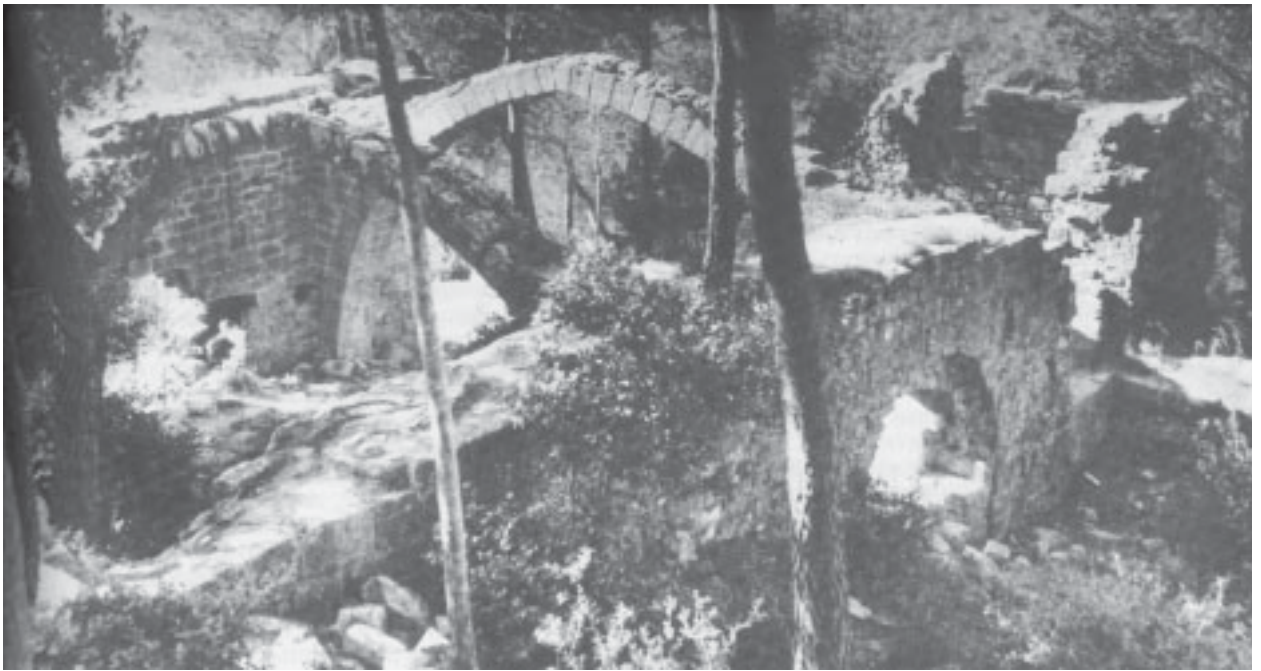
Interiors del castell en una foto reproduïda al volum I dels «Castells Catalans» publicat per l'editor Dalmau publicat l'any 1967.

nar les reparacions que calia fer al castell. D'entre les restes d'aquestes construccions s'ha volgut identificar l'emplaçament de l'església de Sant Miquel, capella del castell i, ahora, parròquia de Castellví. En l'estat actual dels estudis es fa difícil aquesta identificació.