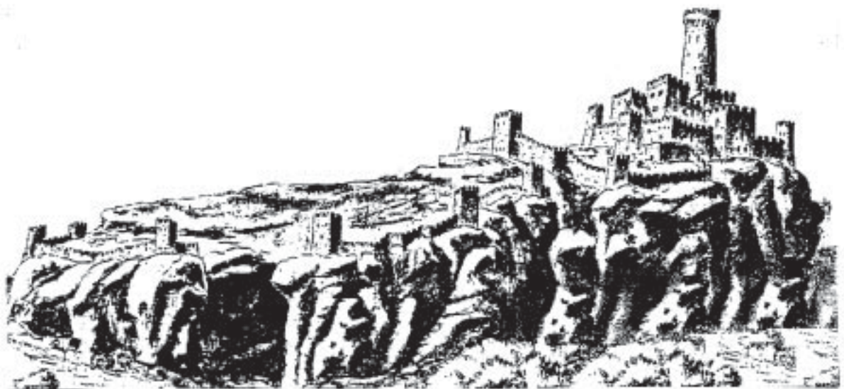
Dibuix sobre el que podia haver estat el castell en la seva millor època