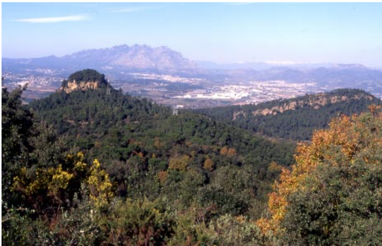
Panorama del castell de Castellvell amb la serra de l'Ataix a la dreta, on hi ha el castell del Pairet. Al fons la muntanya de Montserrat.