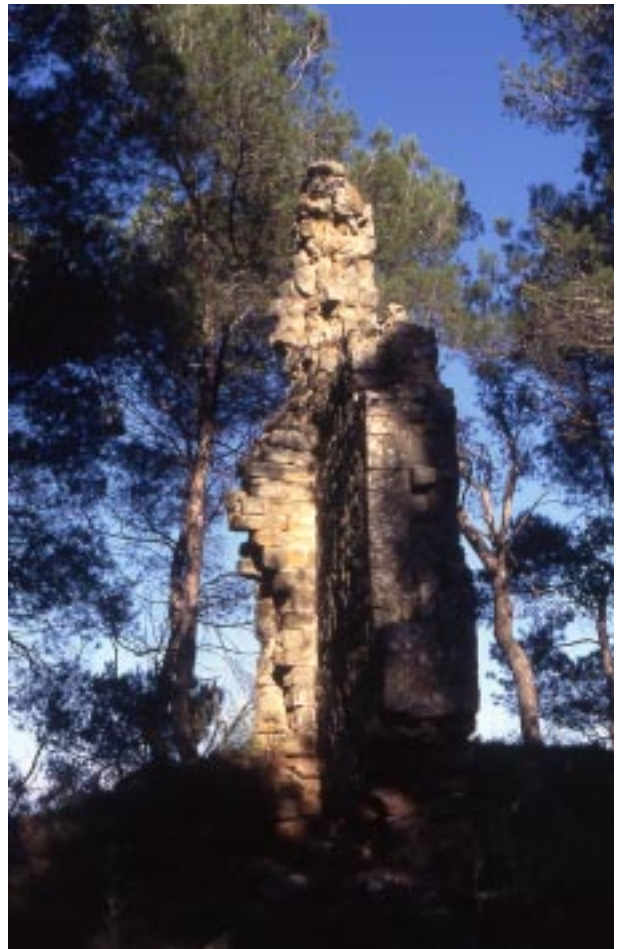
Mur del castell (any 1996).

Tot sembla indicar que també al vessant sud es va formar artificialment una plana (3) mitjançant la construcció de murs per a sus-