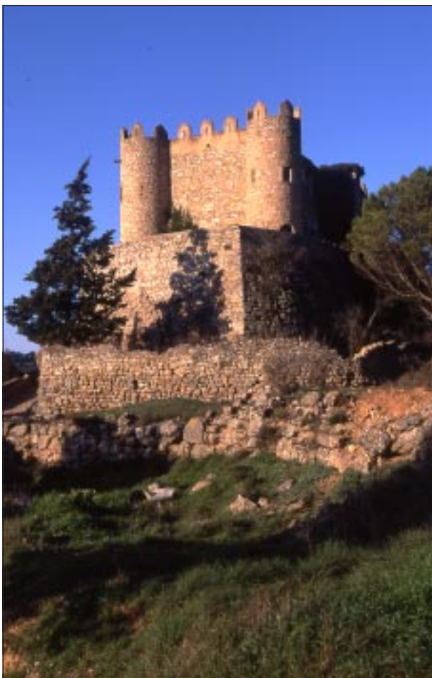
Castell de Biure.