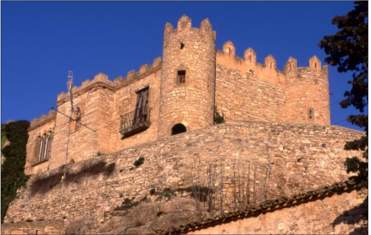
Castell de Biure amb la muralla medieval i el nou castell construït sobre l'antic.

Maalt, concedeix drets sobre el pa, el vi i la carn, entre d'altres. Maalt, ja vídua l'any 1172, junt amb els seus fills, professa a l'orde de l'Hospital, i d'aquesta manera els hospitalers estableixen una casa al castell de Biure. L'any 1241 altre Guillem d'Aguiló, descendent de l'anterior, empenyora el castell i el terme, i l'any 1266 el ven definitivament a l'orde. Els hospitalers completen la possessió del lloc, primer l'any 1277 amb la compra de Galcerà de Puigvert i la seva muller Elisenda de tots els drets que tenen al castell (que els hi