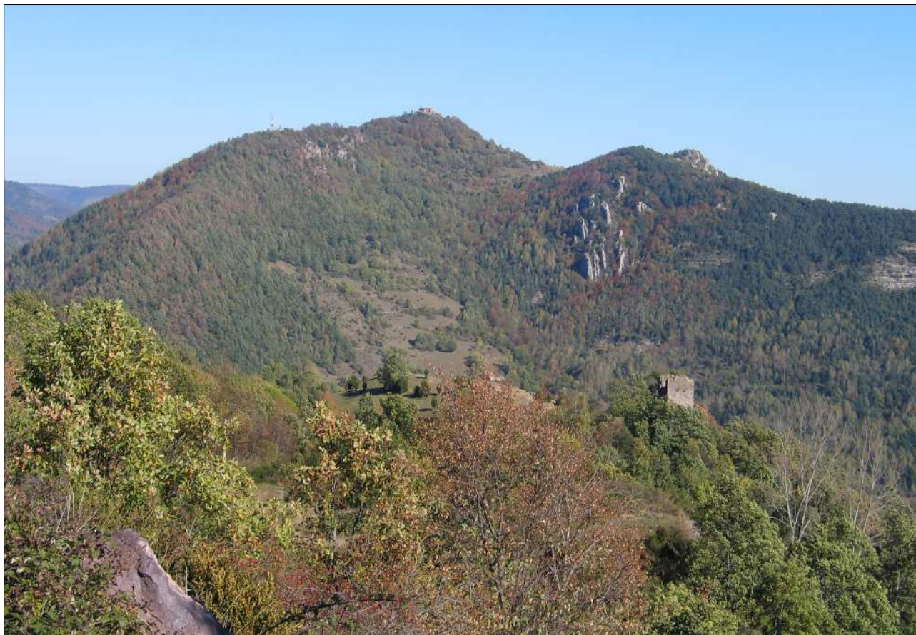
La torre amb el puig de Sant Antoni de Camprodon al fons.

i els seus successors. L'any 1292, durant la guerra amb Jaume II de Mallorca s'ordenà que s'hi instal·lés una guàrdia de 12 homes. La torre era en aquest moment, útil estratègicament.