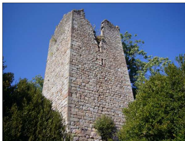
La torre fotografiada l'any 2009 per Ricard Ballo.

A partir de 936-937 comença a documentar-se l'existència d'una fortalesa per donacions o vendes de la fortalesa i terme de Cavallera. No sembla, però, que la fortalesa depengués del monestir que, l'any 1328 en reclamà el domini enfront dels vescomtes de Bas, reclamació que no va reeixir doncs en dates posteriors s'explicita el domini per part del rei i els vescomtes de Bas. L'any 1278 Sibila, comtessa d'Empúries i vescomtessa de Bas reconegué al rei Pere el Gran que tenia en feu, entre altres, el castell de Cavallera pel rei