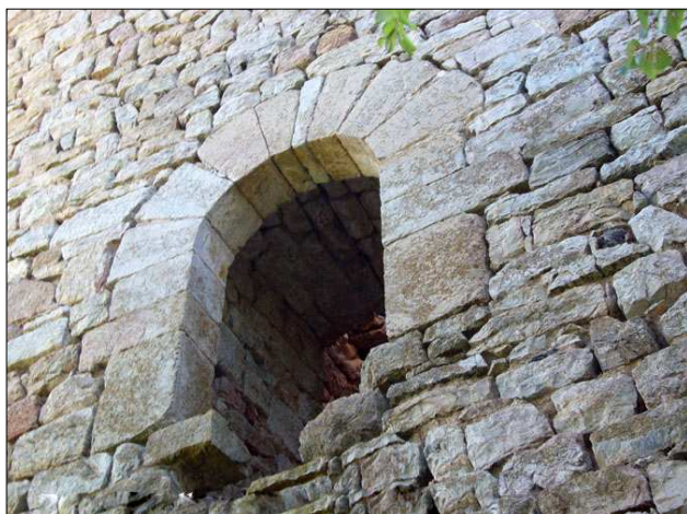
Finestra de la torre. Fotografiada l'any 2009 per Ricard Ballo.

molt, 15 x 75, 30 x 20... A l'interior l'aparell encara és més irregular. Fins i tot, i segurament per raons de construcció, en un racó hi ha unes filades amb opus spicatum.