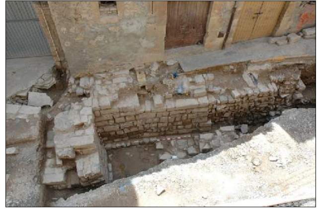
Portal de Sant Antoni.

Eren fetes de carreus de pedra. Les torres són circulars amb cobertes de volta. Pel que fa a la datació, Tàrraga va tenir bàsicament dues fases d'emmurallament. La primera data al voltant del segle XII i encerclaria el primer nucli urbà que creix a