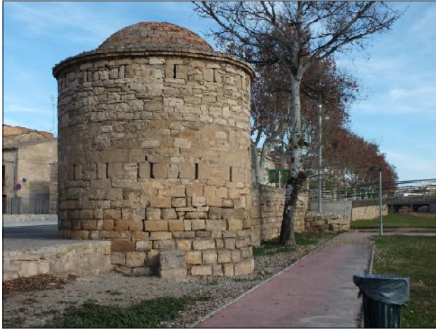
Tram de la muralla.

fins al portal de santa Anna, prop de l'actual boca del carrer Santa Anna que dona a l'avinguda de Catalunya. D'aquí seguiria vers l'est per la part posterior de les cases que donen a l'avinguda de Catalunya fins arribar a la cantonada d'aquest eix viari amb la plaça del Carme, on es conserva una torre circular i part del traçat de la muralla dins de l'edifici del banc Popular i de la cafeteria Liceu (que llinda amb el banc per la banda sud-est.