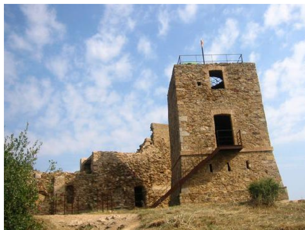
Torre telegràfica i murs del castell.

Com arribar-hi: per accedir-hi cal prendre la carretera GIV-6703 que va al santuari dels Àngels. Passat el km.5 hi ha la Casa de les Figues, punt de referència per agafar una pista que surt per l'esquerra de la carretera i que ressegueix la carena sempre en direcció nord fins a Sant Miquel, passant per les masies de ca la Ferriola i can Mistaire Vell.