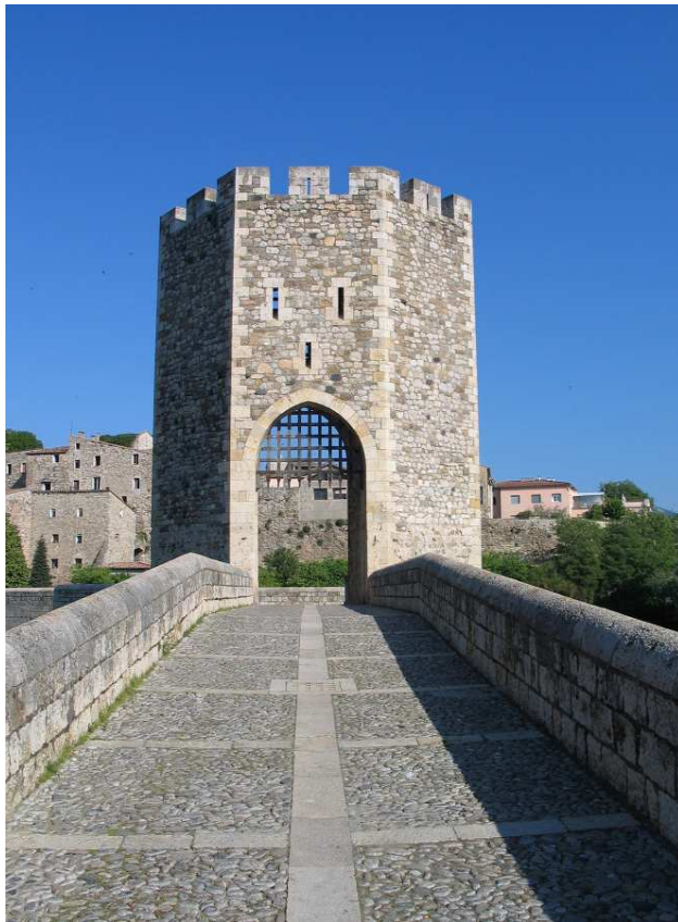
Pont medieval de Besalú.