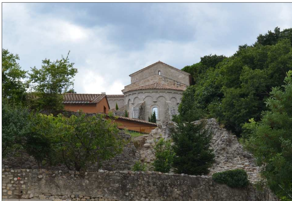
Restes del castell i absis de Santa Maria.

En època del comte Bernat Tallaferro, s'hi feren diversos judicis. Per exemple, l'any 1003 hi ha