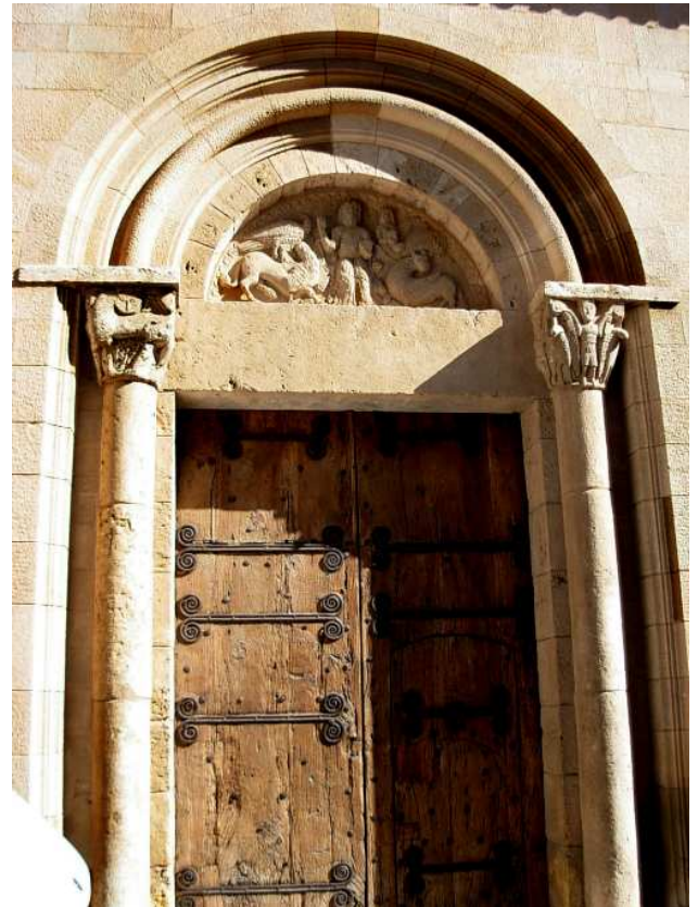
Porta de l'església de Santa Maria actualment al convent de Pedralbes de Barcelona.

Les restes de l'antiga església formen part del conjunt històric-monumental de la vila, en l'àmbit que ocupà el castell, dalt d'un turó actualment de propietat particular.