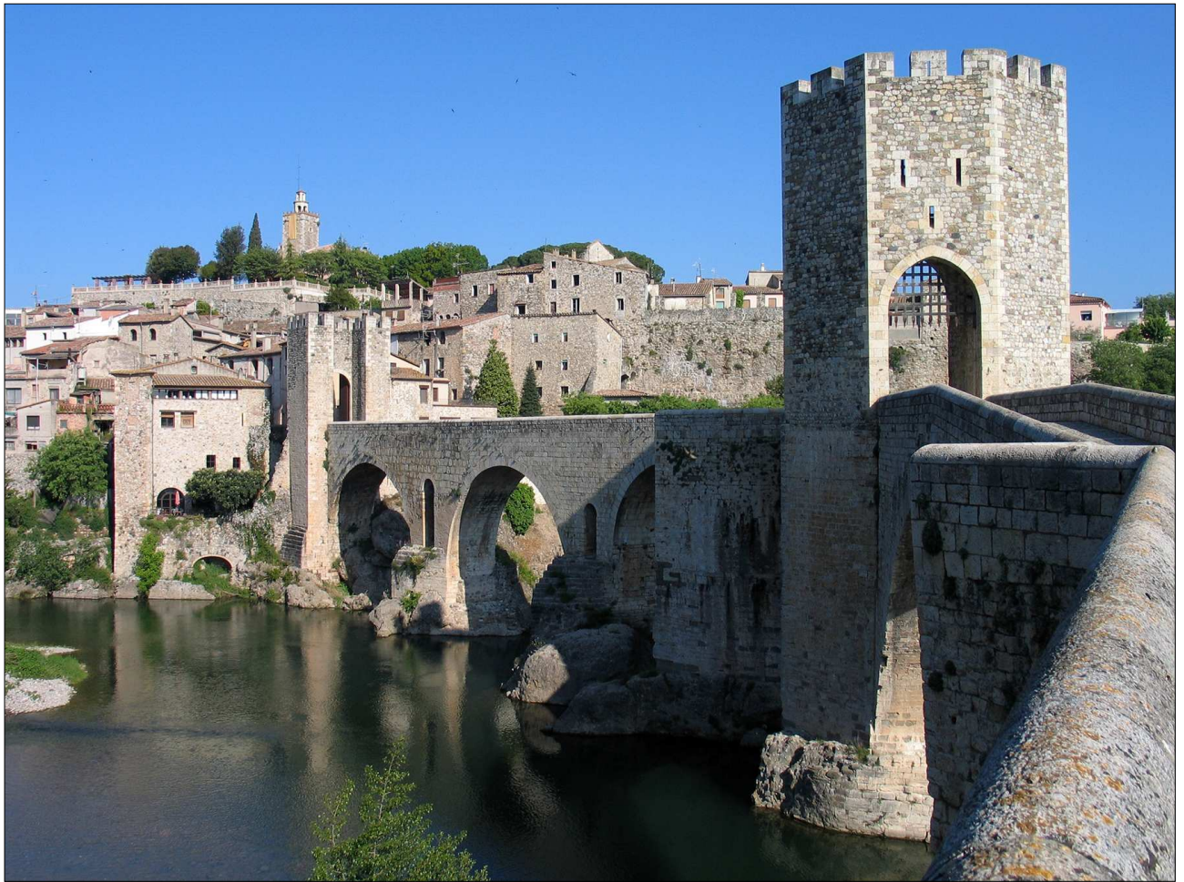
Pont medieval de Besalú.

Va ser construïda vora el castell i com a capella comtal. Es consagrà el 1055. L'any 1137 el comte Ramon Berenguer IV va cedir l'espai del castell i la seva capella als canonges de Santa Maria de Capellada, situada fora de les muralles als peus del turó on era el castell. Aquesta canònica, agustiniana, depenia del monestir de Sant Ruf d'Avinyó, fet que provocà algunes tensions entre els canonges vinguts d'Avinyó i els antics residents. La petita capella del castell no era suficientment gran per a la comunitat de canonges i per aquest motiu es començà a edificar un nou temple en el segle XII.