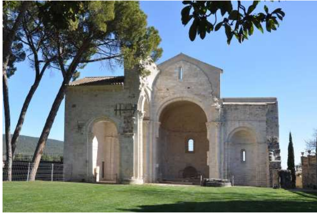
Església de Santa Maria.

documentat un plet « in castrum Bisullunum » per una reclamació feta pel bisbe de Girona. En el testament sacramental de Bernat Tallaferró (any 1021), deixa el castell al seu fill Guillem, dit el Gras que el volgué convertir en un palau. El 1055 es consagra l'església de Santa Maria, situada al castell. L'any 1111, en morir el comte Bernat III de Besalú, el comtat passà a dependre directament del comte de Barcelona Ramon Berenguer III, absorció que provocà un enfrontament amb el comte de Cerdanya Bernat I de Cerdanya. La disputa es resolgué amb certes concessions i l'any 1112, Bernat jurà fidelitat al comte de Barcelona. En el jurament s'esmenta molt particularment el « castello Bisulduni ». La forma « castello » deu substituir a « castrum » per influència del català. Besalú esdevé vila comtal i després reial que depèn de les reines catalano-aragoneses (Peronella, Sança). No obstant, el castell ja havia perdut bona part de la seva funció política i militar i, a partir de 1137, serà cedit en part a la canònica de Santa Maria de Besalú si bé els reis catalano-aragonesos hi continuaren tenint un palau residencial. A la «Crònica de Bernat Desclot», escrita el 1288 i que narra els fets històrics succeïts des del regnat de Ramon Berenguer IV fins a Pere II el Gran, s'hi explica que durant la invasió francesa del 1285 foren assetjats la vila i el castell durant uns quants dies.